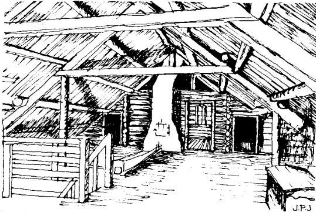
Perspektiv av loftet.

Den nye, store bygningen fikk et representativt eksteriør, spesielt fronten mot vest. Her er midtpartiet markert med et lite sprang frem i vegglivet, som har fått liggende kledning og med kvadre på hjørnene. Listverket fikk her empirens sirlige preg, mens veggene på siden av midtfeltet har stående kledning og en mer nøktern belistning. Mot øst har fasaden fått et helt annet preg, med kraftige, profilerte overliggere av varierende bredde, en tredje utgave av vinduslister og med svalgangen som et markant innslag.