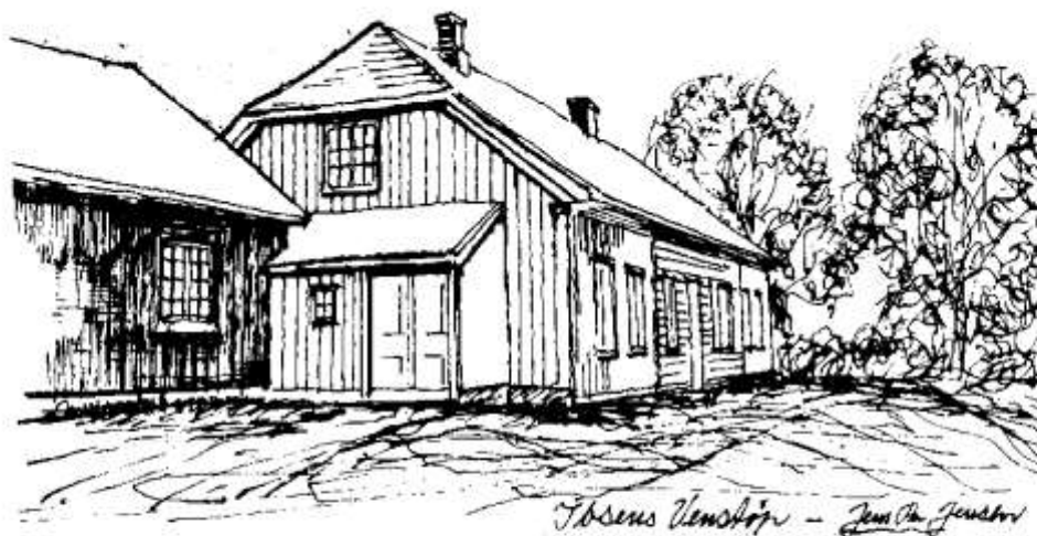
Ibsens Venstøp, perspektivskisse, fra nordvest.