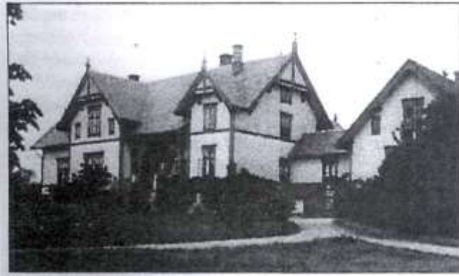
Fra nye Bratsberg gård.