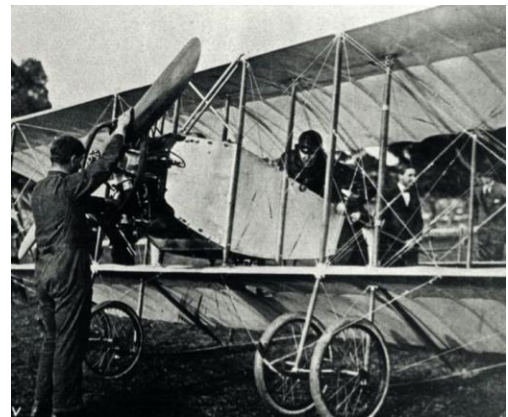
Omtrent slik så flyet ut (illustrasj.)

Over plassen i 6-700 meters høyde slår Chanteloup av motoren. Aeroplanet går rundt i luften og samtidig full fart mot bakken. Plutselig settes motoren igang igjen, og flygeren retter opp flyet i 100 meters høyde og begynner straks å stige igjen, opp til 6-700 meter. Han svingte flyet fra den ene siden til den andre, han steg og falt til høyre og venstre. I neste øyeblikk sto de to vingene rett opp og ned i luften. Den store fuglen gjorde ingen volter, den fløy i en stor bue tilbake til plassen, og her fikk man se et elegant "looping the loop". Chanteloup slo den ene kolbøtten etter den andre. Han gikk ned og rundt og rundt igjen.