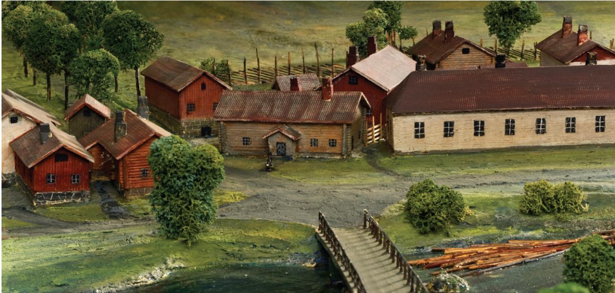
Skolebygningen til høyre i bildet.

Skogen var ikke bare ressurs for jernindustrien. Både sagbruk og tresliperi vokste fram. Dessuten både smie og verksted, brenneri, mølleverk og teglverk ble virksomheter som var med å forme Fossumsamfunnet. En skole ble opprettet på 1650-tallet, og skulle være for "hyttebetjentenes ungdom". Dette antas å være den første "folkeskole" på landsbygda i Telemark, og kanskje også i Norge.