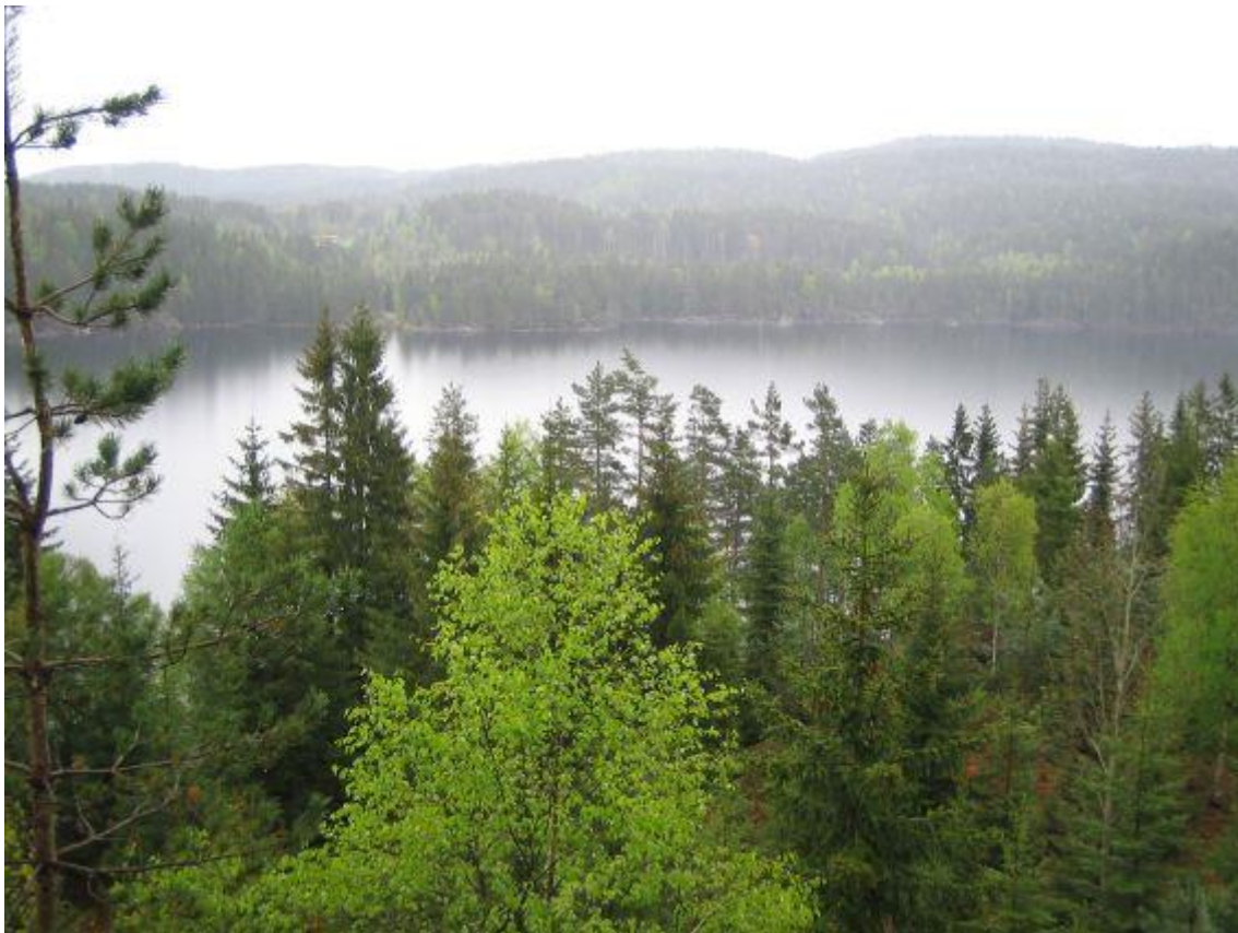
Utsikt ned lia mot Flåte.