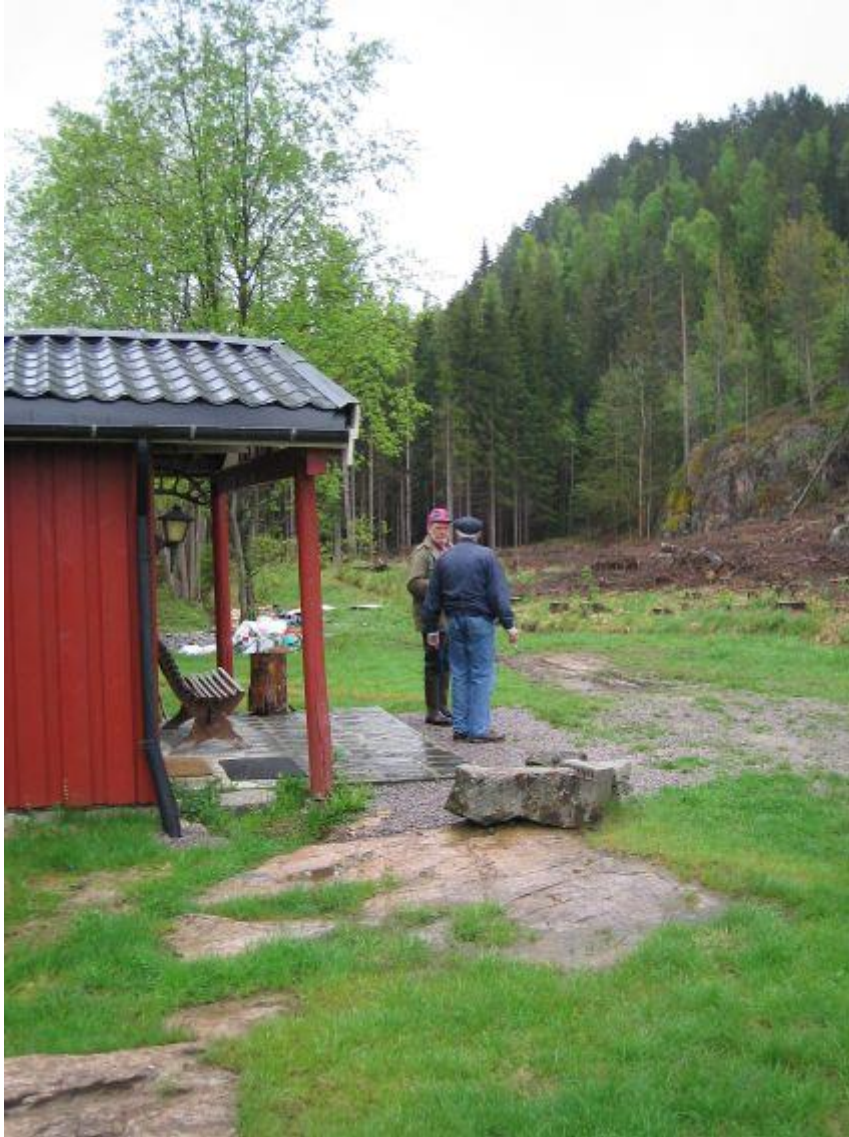
Figur 1 FLÅTELIA