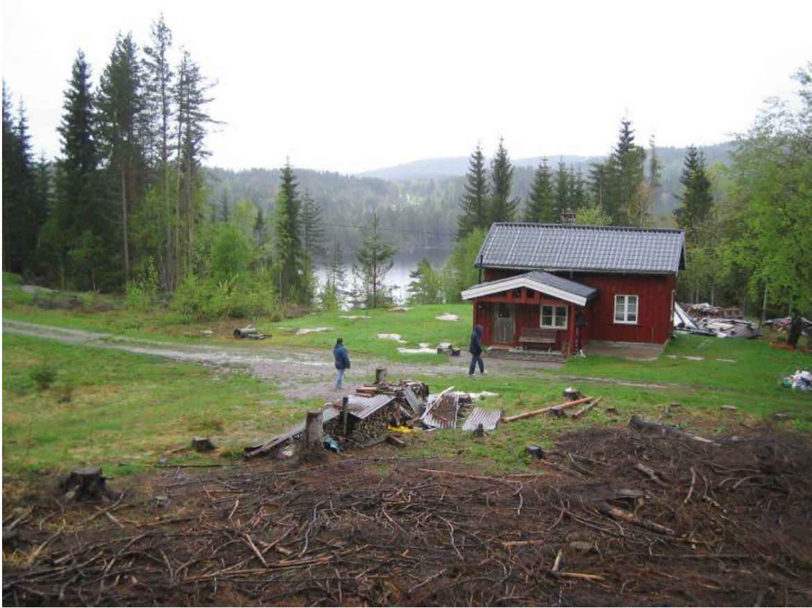
Oversiktsbilde. Skogen er nylig hogget.