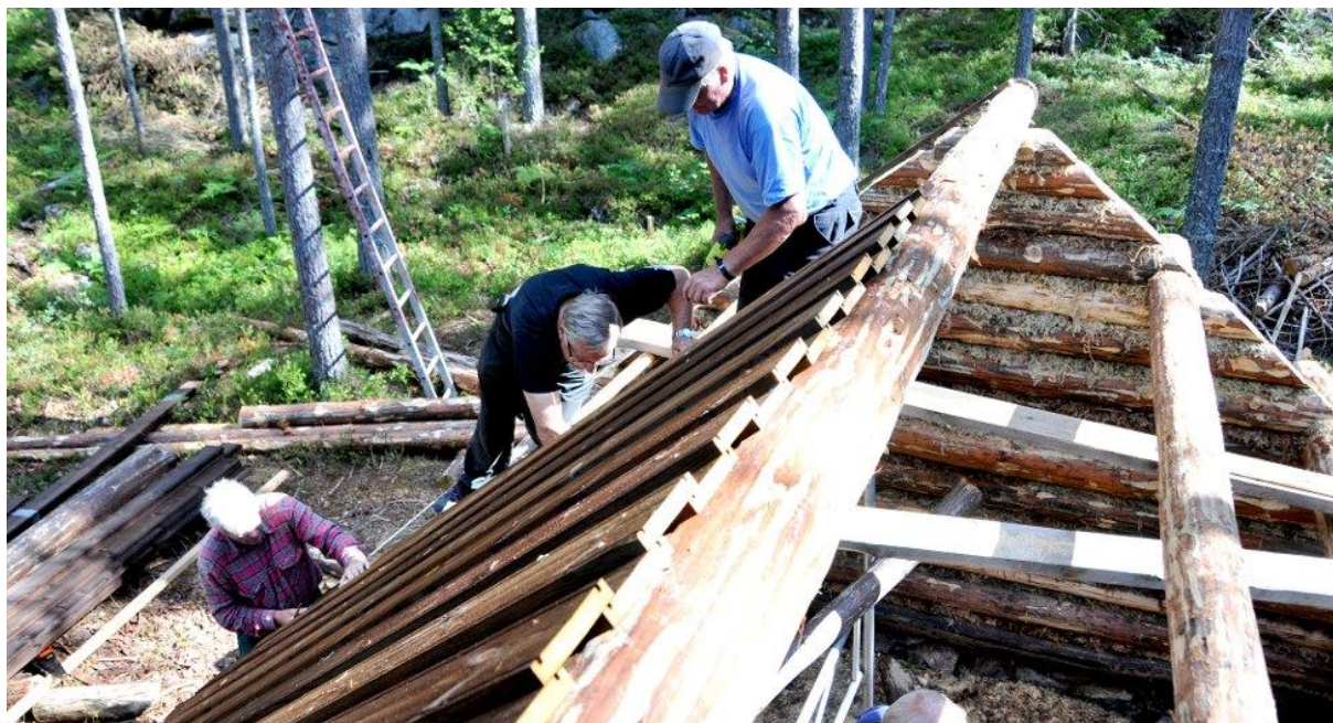
Dugnadsgjeng av interesserte har i 2014 bygget en modell av ei hytte til minne om Hulkaleiren