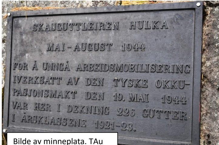
Bilde av minneplata. TAU

Den 8. august 1944 ble en merkedag for skaugutta, som de aldri vil gløkke. Tidlig om morgenen kom en tysk militæravdeling på ca. 170 mann i fullt feltutstyr for å foreta en rassa etter skaugutter. De hadde med seg 20 lastebiler, radiobil og sjukebil. De regnet visst med å gjøre stor fangst. Kilebygda sentral ble underrettet straks tyskerne hadde passert Vold. Straks etter at meldingen var sendt til vaktene på Fjeld,