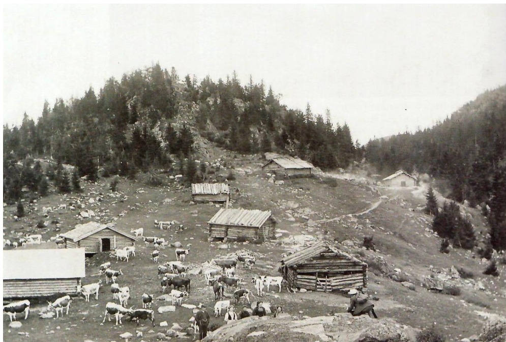
Horta seter i gamle dager

Maleri og tekst av skienkunstneren HP Bratsberg, "Kunstnernatur"