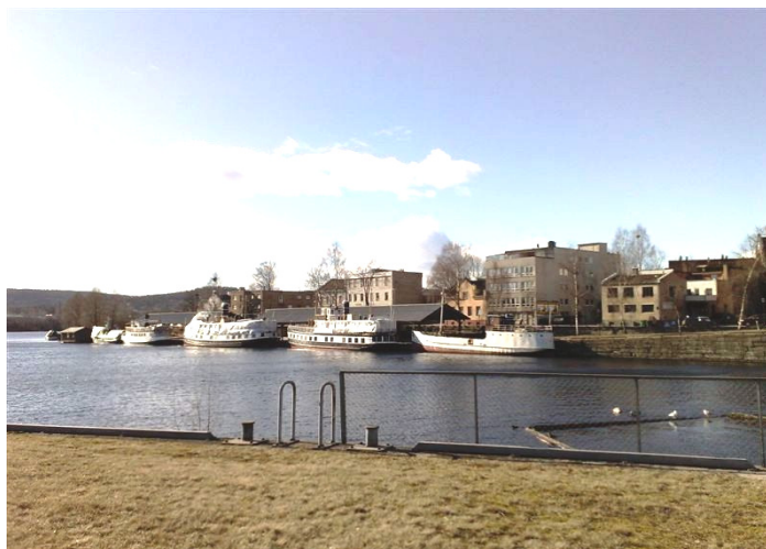
”Telemarkbåtene har langt på vei utspilt sin rolle som rutebåter og fraktfartøyer sett i forhold til de 150 foregående åra. Nå er det turistbåter og noe nyttetraffikk på Telemarksbrygga som i sin tid var start-, ende- og hovedstasjon for trafikken på Telemarksvassdraget”

Fra gammelt av leide telebøndene seg inn i Hjellen når de kom til byen for å handle. Bjerks enke, Falkums enke og Ditlefsens enke var kjente losjhus i området. På den korte strekningen lå det også fem utskjenkningssteder for brennevin. Gulvene i skjenkelokalene ble strødd med sagmugg, «som om kvelden av gjestene blev dekorert med brune rosetter, når de efter endt arbeidstid stakk innom og tok sig en dram eller to.»