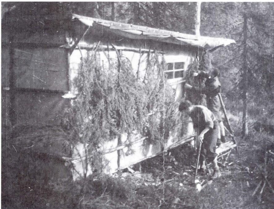
Fra O 1704 Skiens celle ved Ormtjern. Dette var den ene av O 1704's 3 celler i området ved Hoppefjell.