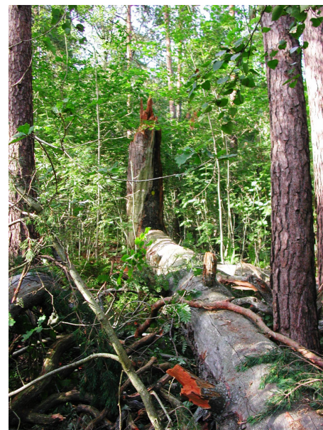
TAu Kjempa har kjempa

Litt lenger oppe kommer vi til en mur - nærmest en steinrøys nå. Her lå den gamle bygdeborgen der folket fra Lunde, Falkheimr og andre bosteder sendte sine kvinner, gamle, barn og sin buskap når fiender var på ferde. Murene er forfalt, enkelte steder er de nesten forsvunnet. Steinen har vært god å ta til når det skulle bygges veg og grunnmurer i nabolaget. Men vi kan følge muren rundt plataet der det ikke er naturlig styrtning som gjør mur overflødig.