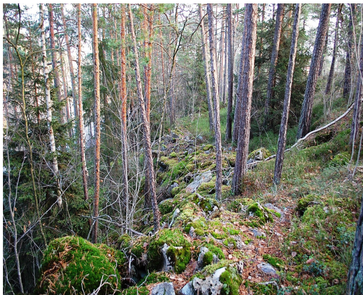
TAu Bygdeborgen Kjempa

Her har ventelig den gamle vegen fra Øst-Telemark til havet gått. Ved Vaddrættet har de vadet eller ridd over Farelven (Storelva) og så går vegen over åsene til Knardalsstrand der de hadde sine knarrer stående mellom hvert vikingetokt eller handelstokt til det store utland. I den tiden var det hverken Klosterfossbru eller Ulefossbru eller Akkerhaugenbru, vadene var eneste elveovergangen for reisende med hest.