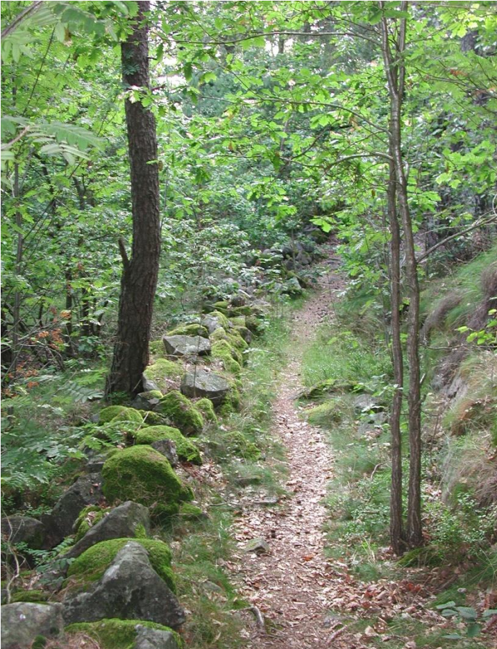
Kjempa bygdeborg, nedre skanse, bygdeborgveien, Foto TAU

nødvendig, dersom de skulle hatt mulighet til å varsle de sentrale gårdene. Flere av borgene kan ha inngått i mindre nettverk, hvor enkelte av storgårdene var involvert. Disse nettverka hadde som hovedmål å hindre angrep, og varsle at en trussel var på vei. Nettverka besto av både utkikksposter, kontrollborger og tilfluktsborger. Borgene kan ha varslet hverandre med et vetesystem.